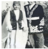
Сур. 2. Қоңыр әйелімен [4.]