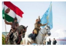
Сур. 5 [8.]