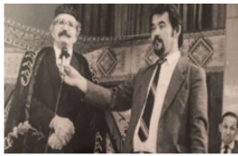
Сур. 1 [3.]