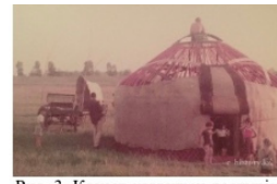
Рис. 3 Қоңыр қазақтың дәстүрін сақтай отырып, киіз үй тікті [5.]

Ол түркітану саласында 16 мыңға жуық қолжазбаларқалдырды. Және ол қазақтар – қыпшақ-мажарлардың туыстары деп сенді.