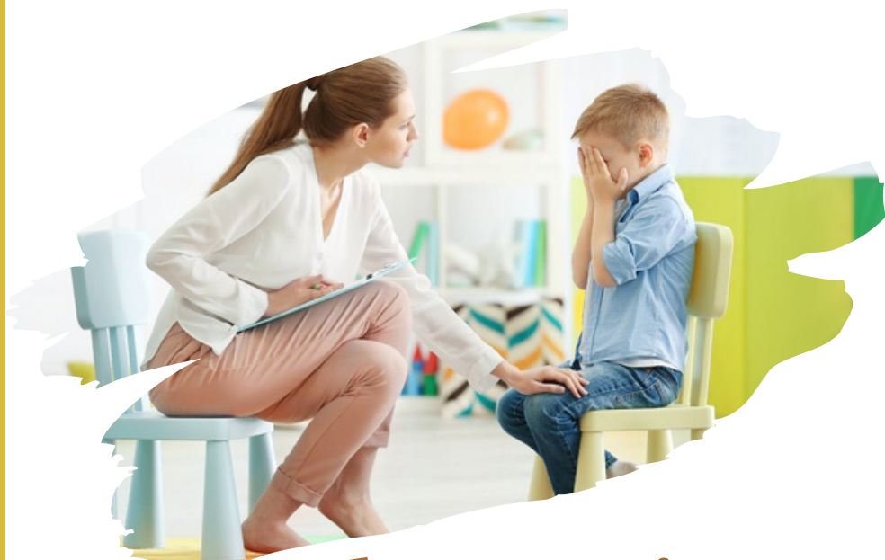
Кеңес беру, сенім